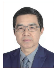
欧阳明高 全国政协常委 中国科学院院士 清华大学车辆学院教授