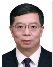
邱勇 全国人大常委会 中国科学院院士 清华大学党委书记