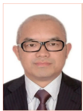
周光权 全国人大代表 无党派人士 清华大学法学院教授

化、国际化。此外,建议在中医药的大学教育中加强现代生命科学、生物信息学等学科的相关教育,培养中医药专业学生架设与国际沟通和接轨的桥梁,从而将中医更好地推向世界。希望有关方面高度重视,科学地谋划中医药的发展,认真落实中医药的守正创新,鼓励其他学科的力量加入到中医药的交叉创新中来,真正实现中西医并重。(来源:环球时报)