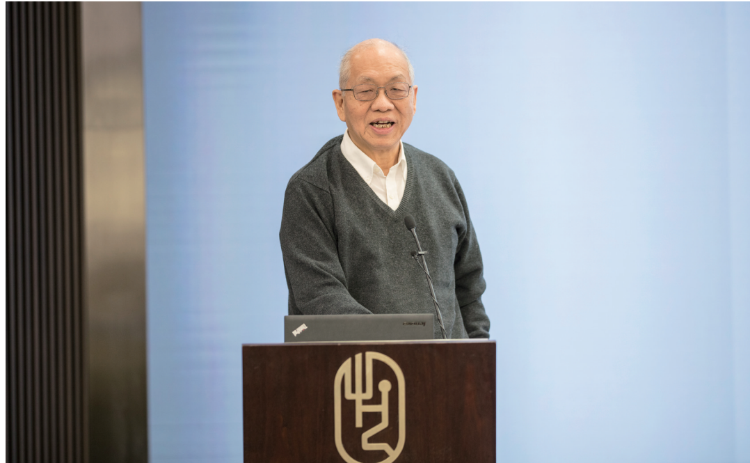
丘成桐在清华大学美育研讨会上发言。

2000多年前,希腊学者开始了对数学之美的追寻。随着人类的感受能力、学习能力不断变化,数学这门学科也发生了不少变化。这是个很有意思的过程。可以说,数学是一个重要的桥