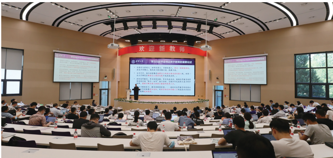
“新教师导引计划”迎新周活动现场。

加强制度体系建设。发布《关于进一步加强和改进新时代师德师风建设的若干措施》,围绕领导体系建设、教师思政工作、考核评价机制、师德师风培养涵养、选树优秀典型等推出16条具体举措。发布《教职工奖励规定(试行)》,激励全校教职工教书育人、立德树人。制定《研究生导师管理办法》,明确研究生导师师德要求。持续加强“导学思政”体系建设,建成17处导学交流空间,在全校营造尊师重教、导学共进的良好氛围。