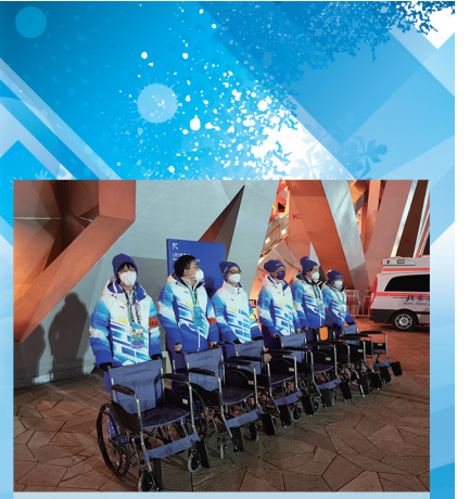
助残服务志愿者就位。

3月4日晚,北京冬残奥会开幕式在国家体育场鸟巢隆重举行。本次开幕式秉持“简约、安全、精彩”的办会宗旨,以“生命的绽放”为主题,将象征着团结、友谊、共融的“同心圆”概念贯穿始终,展示着属于中国人的温暖与浪漫。清华大学的“小雪花”们也再次绽放,雪容融接力冰墩墩,再一次见证冰雪奇迹。