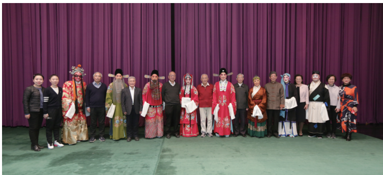
教师观众代表与艺术家合影。

本报讯 3月1日晚,由北京市教委主办、清华大学承办的“戏曲进校园——2022校园戏曲节”在清华大学开幕。