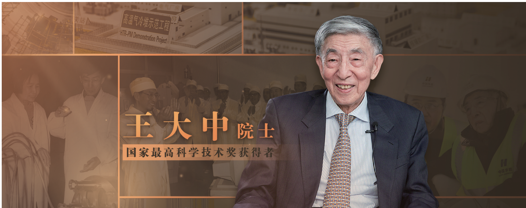
图片设计/梁晨

上世纪五十年代,王大中从国家战略出发,坚定选择了自主创新的先进核能技术研发之路。他带领团队从无到有,开展了几十年的艰难探索,使中国以固有安全为主要特征的先进核能技术从跟跑到领跑世界。