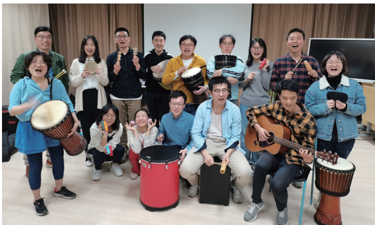
音乐减压心理工作坊。

本报讯 清华大学学生心理发展指导中心(以下简称“心理中心”)本学期专门针对毕业年级学生推出六大服务,全方位地为毕业年级学生提供了心理支持,助力同学健康成长。