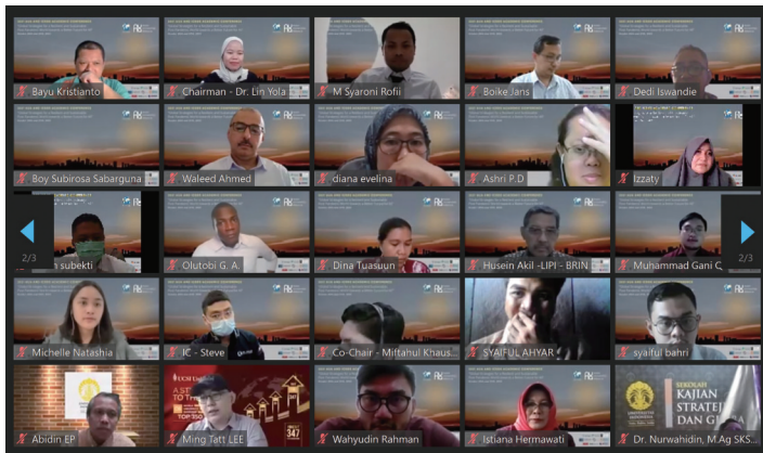
部分与会学者合影。

本报讯 10月26日至27日,亚洲大学联盟成员印度尼西亚大学在线举办了2021年亚洲大学联盟“建设美好的生命共同体——后疫情时代的可持续发展”全球战略学术会议。亚洲大学联盟主席、清华大学校长邱勇发表视频致辞。本次学术会议邀请了来自不同背景的专家、学者和青年学生,从专业知识及经验出发,讨论了如何在后疫情时代建设一个更加美好的未来。