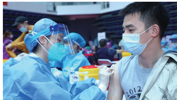
医务人员为师生接种疫苗。