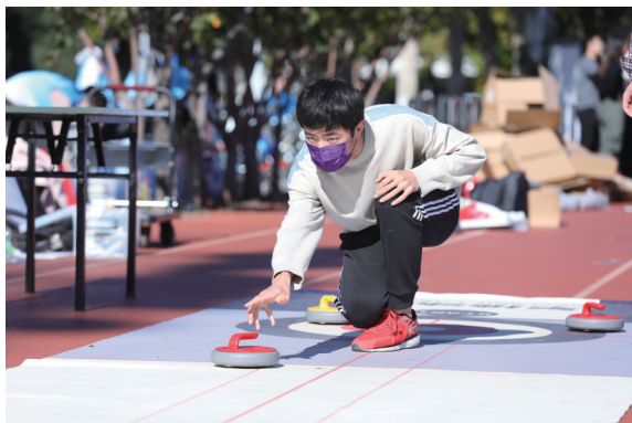
“冬奥竞赛项目大PK”中,同学体验旱地冰壶项目。