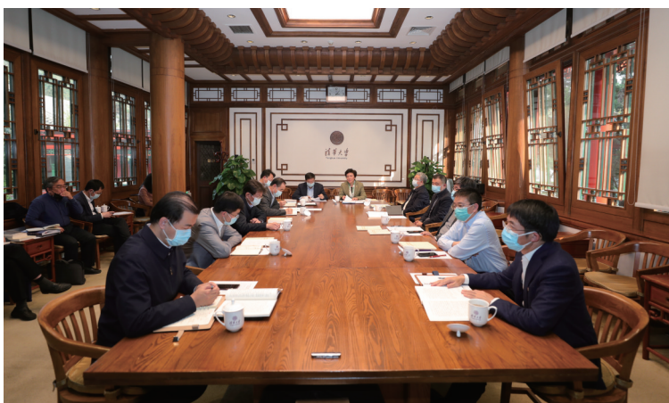
专题学习研讨现场。