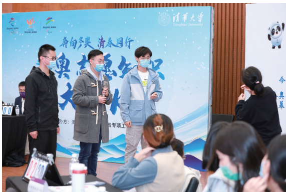
“冬奥志愿知识大PK”决赛现场。

本报讯 冰雪盛会,百日为期。为在全校范围内进一步普及奥运知识、推广冰雪运动,鼓励清华学子发扬优良体育传统,助力“带动三亿人参与冰雪运动”目标的实现,在北京2022年冬奥会倒计时100天之际,清华大学在严格落实疫情防控要求的前提下,开展冬奥倒计时百天系列主题活动。