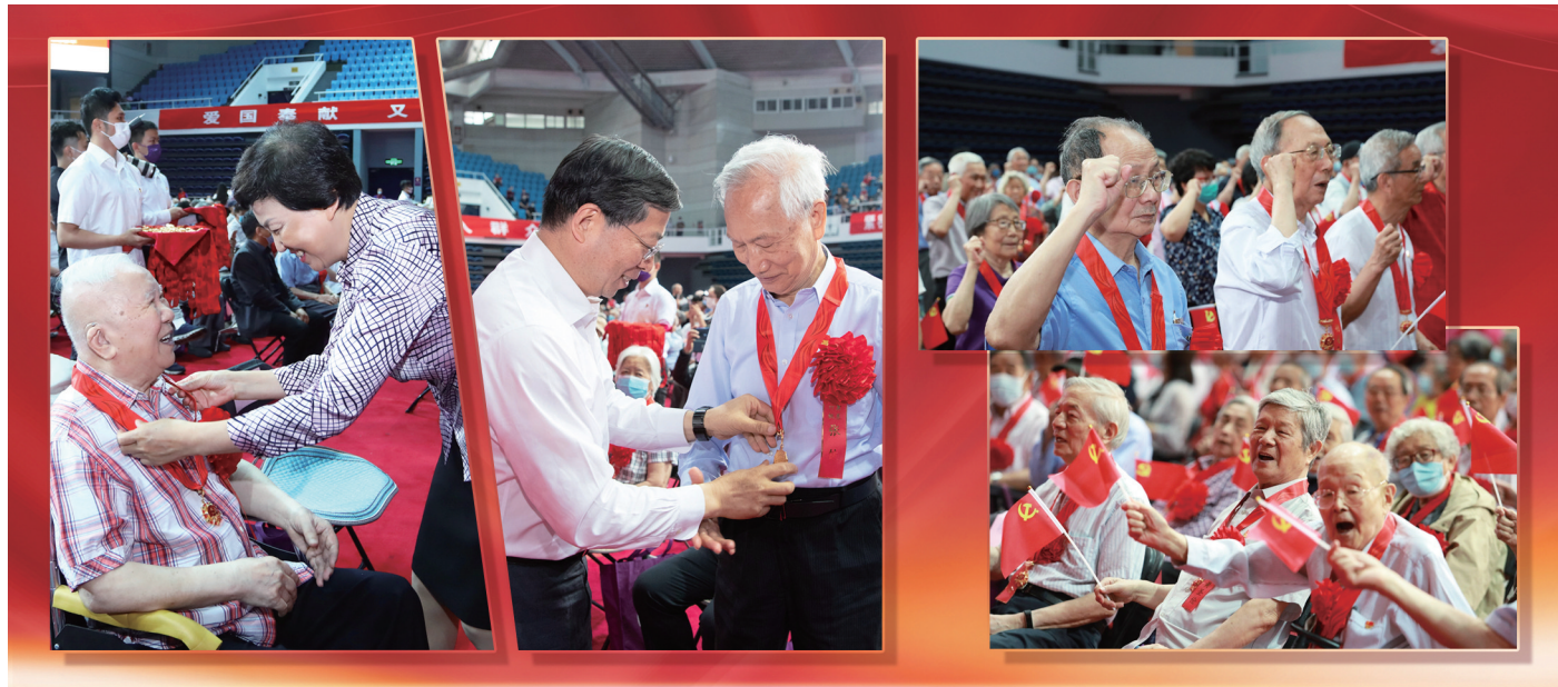
为了从政治上激励、精神上鼓舞广大党员,进一步增强党员的荣誉感、归属感、使命感,党中央决定,2021年首次颁发“光荣在党50年”纪念章。清华大学共有1495名老党员获得该纪念章。6月16日上午,清华大学“光荣在党50年”纪念章集中颁发仪式在综合体育馆隆重举行。