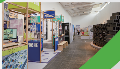
环境艺术设计系展厅