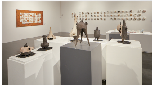
陶瓷艺术设计系展厅