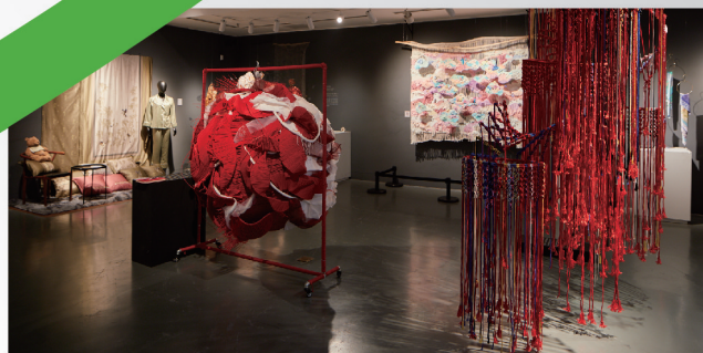
染织服装艺术设计系展厅