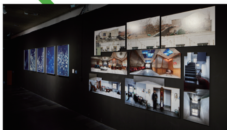
信息艺术设计系展厅