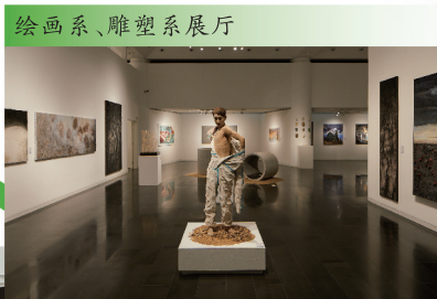
绘画系、雕塑系展厅