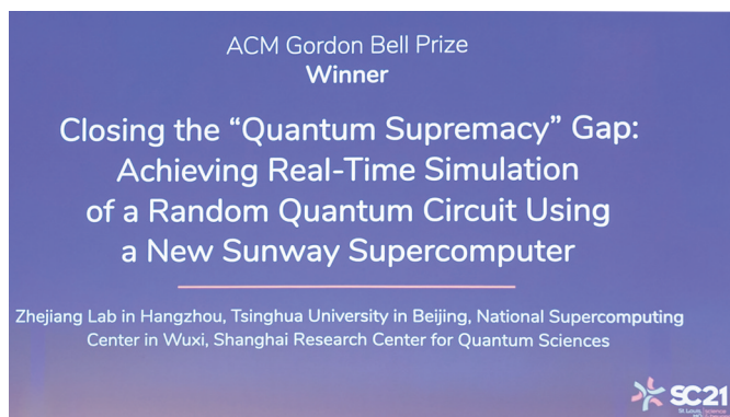
全球超级计算大会公布获奖团队及项目。