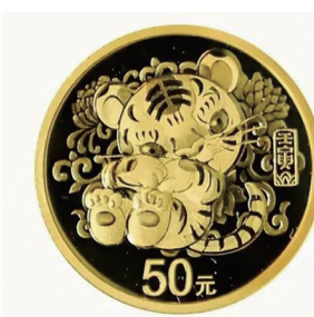
“抱抱虎”金银纪念币。

本报讯 11月18日,中国人民银行发行了2022中国壬寅(虎)年金银纪念币一套。其中,3克圆形金币与15克圆形银币背面图案——“抱抱虎”由清华大学美术学院教授吴冠英设计创作。“虎”与“福”“富”谐音,寓意福运临门、富贵临门。图案采用“抱虎”的拟人化姿态造型,