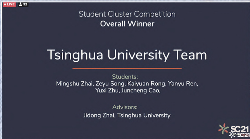
清华团队获得SC21超算竞赛总冠军。