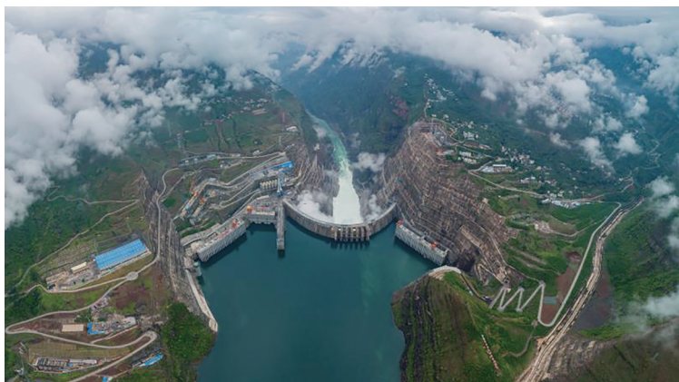
白鹤滩水电站建设工程鸟瞰图。

本报讯 6月28日,金沙江白鹤滩水电站首批机组正式投产发电,习近平总书记发来贺信,李克强总理作出批示,韩正副总理出席投产发电仪式并宣布白鹤滩水电站首批机组正式投产发电。习近平在贺信中指出,白鹤滩水电站是实施“西电东送”的国家重大工程,是当今世界在建规模最大、技术难度最高的水电工程。全球单机容量最大功率百万千瓦水轮发电机组,实现了我国高端装备制造的重大突破。全体建设者和各方面发扬精益求精、勇攀高峰、无私奉献的精神,团结协作、攻坚克难,为国家重大工程建设作出了贡献。这充分说明,社会主义是干出来的,新时代是奋斗出来的。