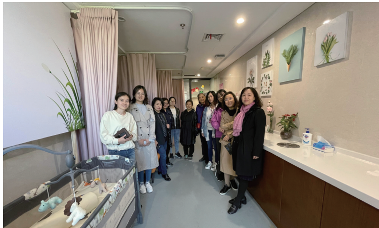
校工会女教职工委员会成员调研基层工会母婴室建设。

本报讯 党史学习教育开展以来,校工会将党史学习教育与总结经验、观照现实、推动工作、解决实际问题相结合,开展了一系列“我为群众办实事”实践活动,集中解决教职工关心的问题,积极为学校发展营造和谐健康的环境和氛围。