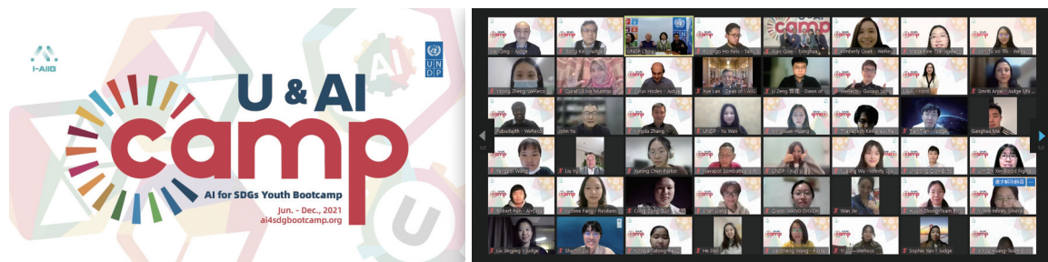
人工智能促进可持续发展青年创造营决赛海报。参会人员合影。

本报讯 11月16日,由清华大学人工智能国际治理研究院主办,联合国开发计划署(UNDP)支持,多家人工智能学术机构参与的人工智能促进可持续发展青年创造营(U&AI Camp | AI for SDGs Youth Bootcamp)决赛在线上举行。清华大学副校长杨斌、联合国开发计划署驻华代表白雅婷、清华大学人工智能国际治理研究院院长薛澜出席并致辞。