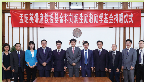
深鉴科技创始人捐资母校清华。