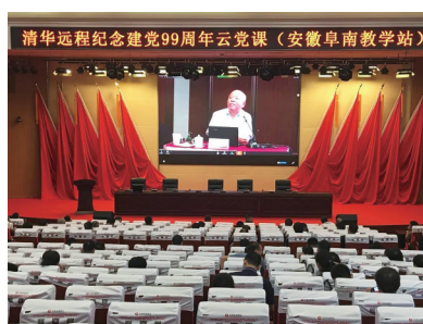
安徽阜南教学站同上清华“云党课”。

“经过全党全国各族人民共同努力，在迎来中国共产党成立一百周年的重要时刻，我国脱贫攻坚战取得了全面胜利。”2月25日上午，全国脱贫攻坚总结表彰大会在北京人民大会堂隆重举行，中共中央总书记、国家主席、中央军委主席习近平向全国脱贫攻坚楷模荣誉称号获得者颁奖并发表重要讲话。大会还对全国脱贫攻坚先进个人、先进集体进行表彰。