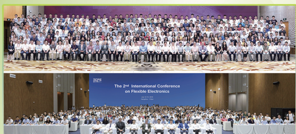
柔电中心已成功举办两届全球柔性电子学术大会。