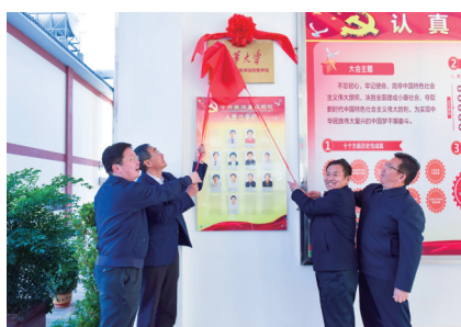
2019年12月，乡村振兴云南南涧远程教学站揭牌。