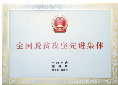
全国脱贫攻坚先进集体奖牌。