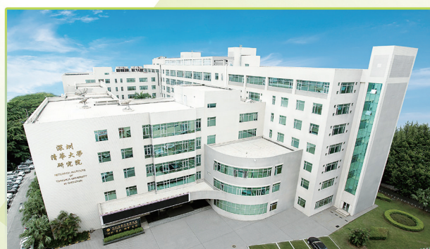
深圳清华大学研究院外景。