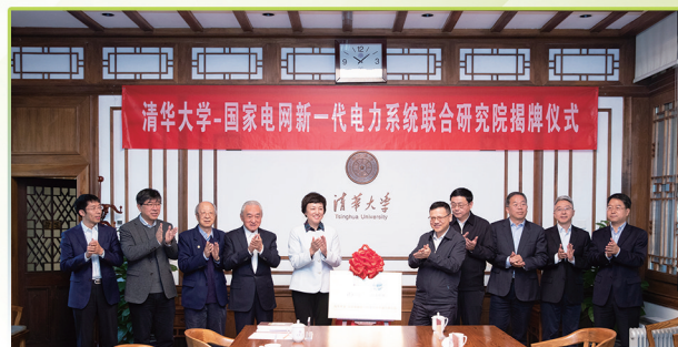
2019年11月8日，清华大学-国家电网新一代电力系统联合研究院揭牌。