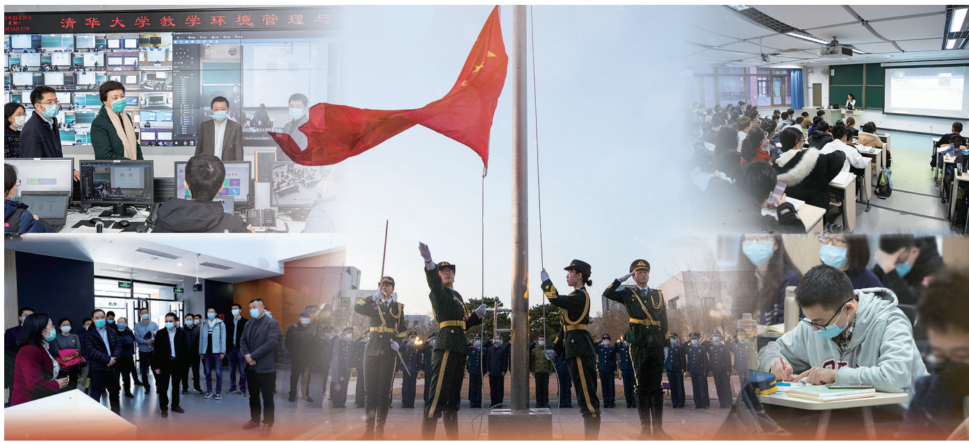
清华大学2021年春季学期如期开学,在开学第一天的升旗仪式上升起的五星红旗冉冉升起,融合式教学工作顺利、有序开展。校党委书记陈旭,副校长吉俊民、杨斌、彭刚等带队实地查看开课和教学设施情况,要求扎实做好疫情常态化防控工作,以最大热情保障教育教学秩序井然。