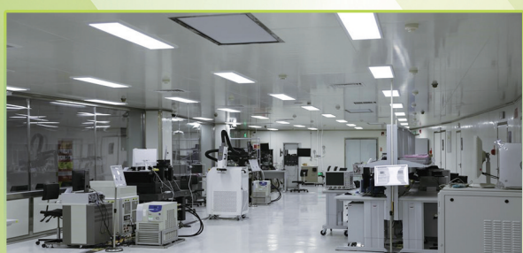
未来芯片中心的芯片测试平台。